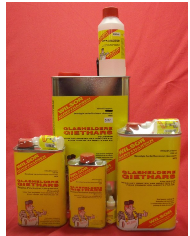
Glasheldere giethars setten van: 250, 500, 1000 en 5000ml

Als de hars nog vloeibaar is kunt u insecten, bladeren of in dit voorbeeld een dobbelsteen leggen. Let erop dat er geen luchtballen ingesloten worden.