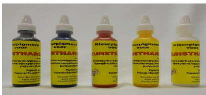
Pigment zwart, blauw, rood, geel en wit